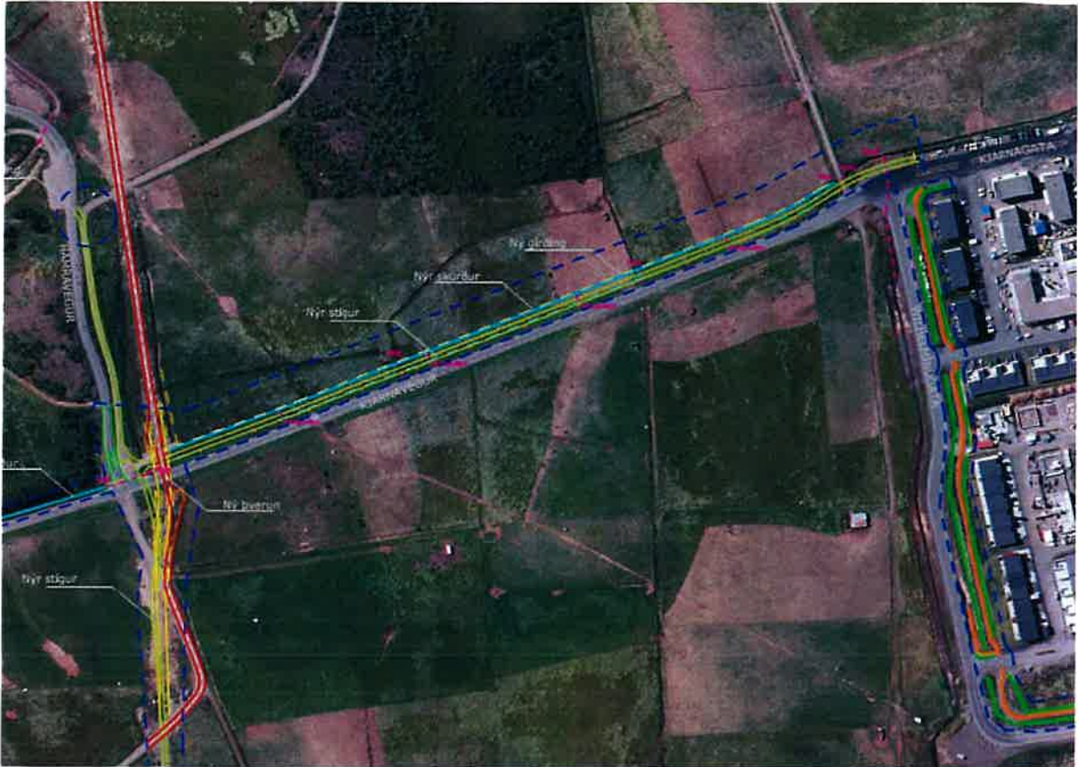
Mynd 1 – Sýnir fyrirhugaða framkvæmd