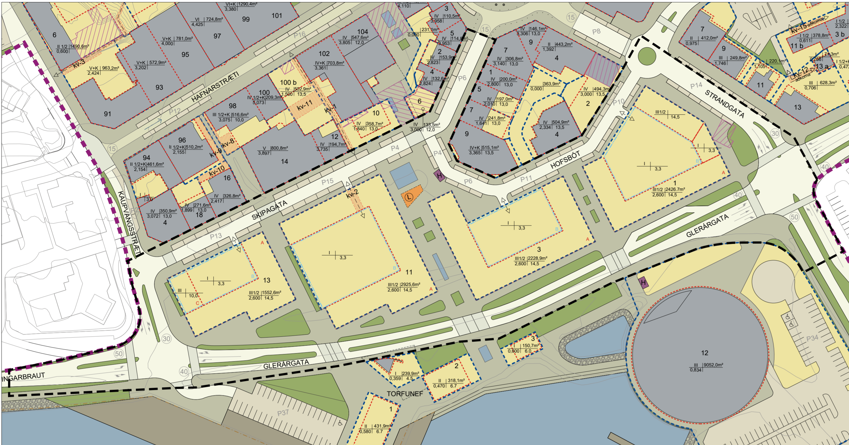
GILDANDI DEILISKIPULAG, ÖBLAÐIST GILDI 22.07.2014, M.S.BR.