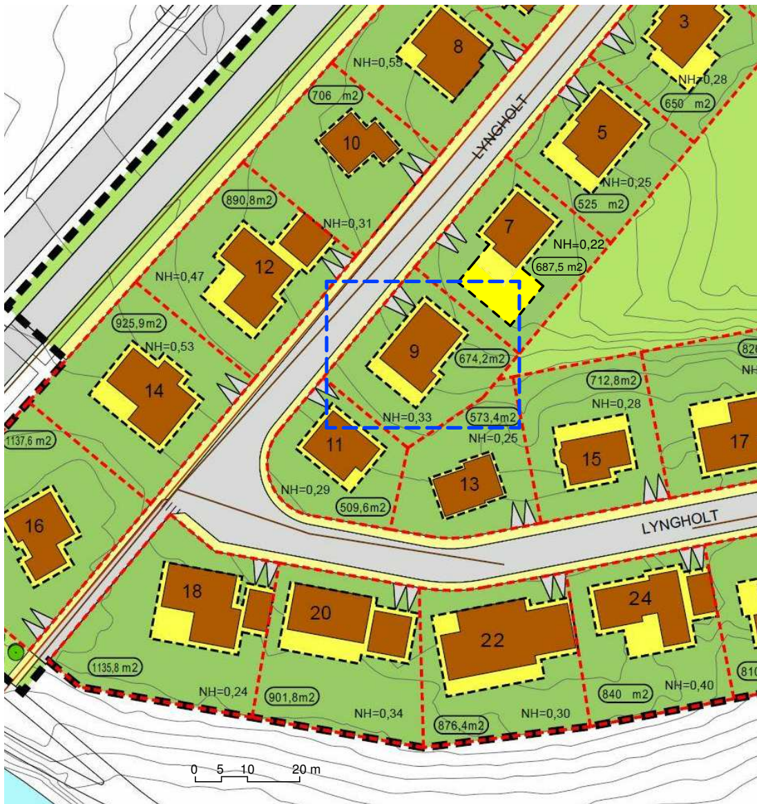
NÚGILDANDI DEILISKIPULAG, TÓK GILDI 17. DES 2012 1 : 1000