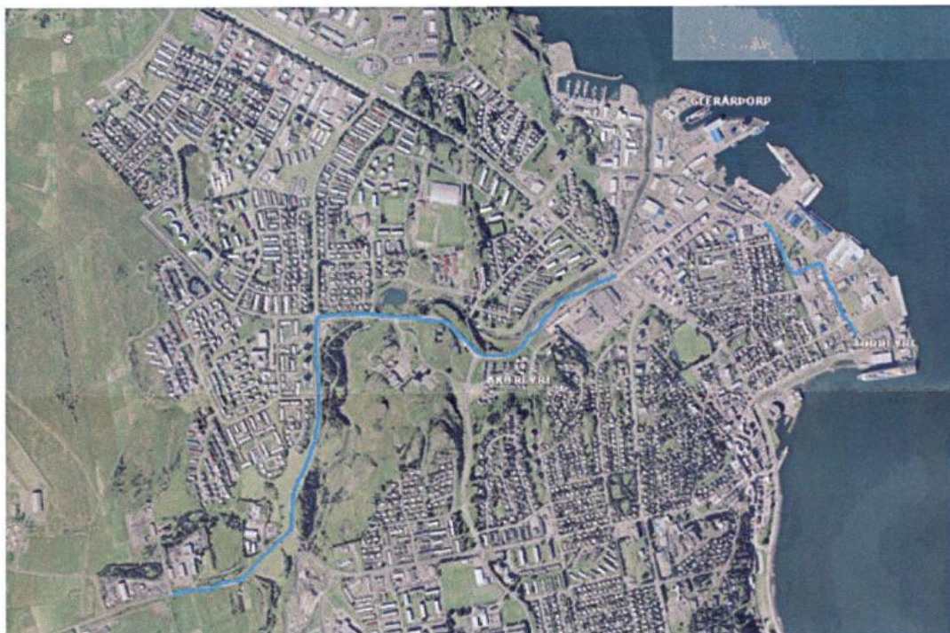
Kort úr bréfi Vegagerðarinnar

Umræddir vegkaflar eru þó ekki réttir hvað varðar lengd Hjalteyrargötu og Laufásgötu og Akureyrarbær á Silfurtanga og hefur alltaf gert. Vegagerðin hefur viðurkennt að ekki sé um rétta vegkafla að ræða og réttir vegkaflar eru þeir sem koma fram í samantektinni. Á öðrum fundum með Vegagerðinni hafa þeir varpað því fram að þeir hafi einungis fjármagn til að leggja nýtt malbik „bræða yfir“ þessa götukafla og það þurfi þeir að gera nú í sumar 2017, 2018 og síðasta kaflann 2019. Þeir vilja skila hverjum kafla um leið og búið er að bræða yfir og mundi þá Akureyrarbær taka við rekstri þessarar kafla fyrst 2017 næsta kafla 2018 og síðasta kaflann sumarið 2019. Engu að síður hafa þeir heimild til að annast veghald þessarar vega til ársloka 2019! Hvað á að gerast eftir 2019?