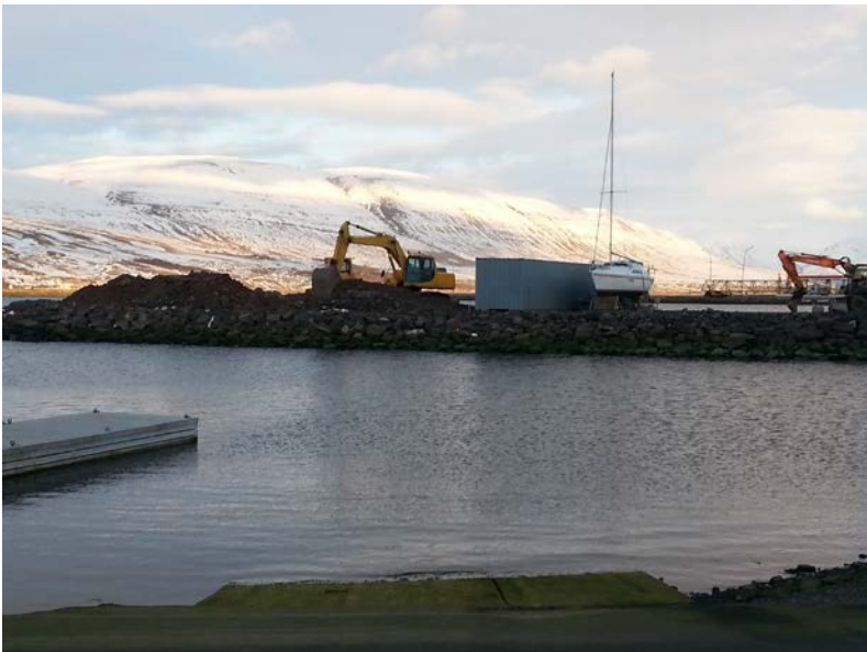
Mynd 3: Landfylling þar sem hús á að rísa