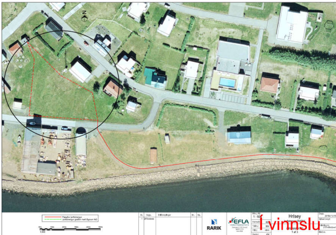
Mynd 3. Lagnaleið jarðstrengs að spennistöð

Í líð r eru tvær leiðir sem koma til greina fyrir jarðstreng að spennistöð en vegna aðstæðna hefur ekki verið metið hvor leiðin er æskilegri. Óskað er eftir að báðar leiðirnar verði heimilaðar þó svo önnur þeirra verði notuð.