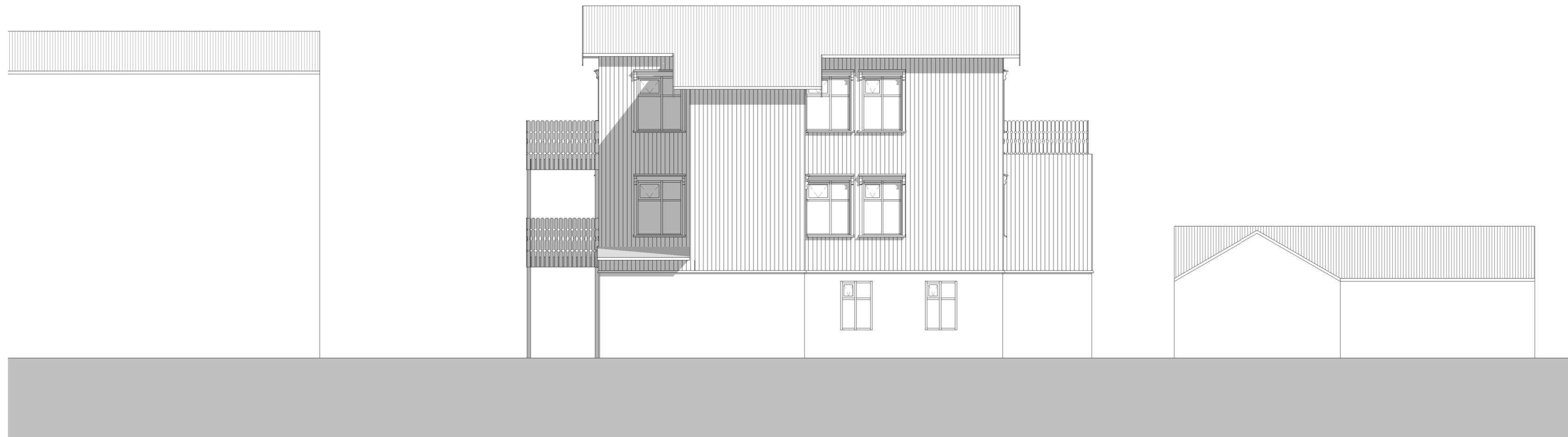
1 Útlit Norður 1 : 100