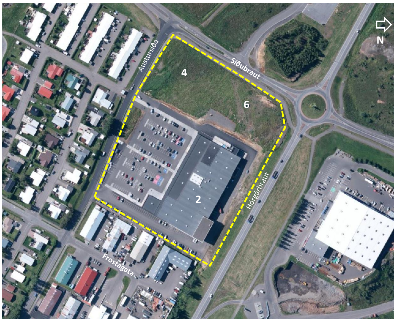
Mynd 1. Loftmynd sem sýnir staðhætti, gul brotin lína sýnir það svæði sem breytingin nær til.

Svæðið sem breytingin nær til afmarkast af Austursíðu í suðri, Síðubraut í vestri, Hörgárbraut í norðri og af lóðarmörkum milli Austursíðu 2 og lóða við Frostagötu í austri. Stærð svæðisins er um 3,5 ha.