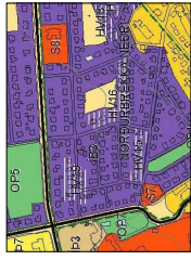
ADALSKIPULAG AKUREYRAR 2015-2030