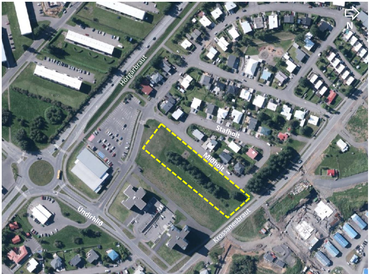
Mynd 1. Loftmynd sem sýnir staðhætti, gul brotin lína sýnir það svæði sem breytingin nær til.

Skv. skipulagslögum nr. 123/2010 skal við upphaf vinnu við gerð skipulagsáætlunar, aðalskipulagsbreytingar í þessu tilfalli, taka saman lýsingu á skipulagsverkefninu þar sem m.a. er skýrt hvernig staðið verði að skipulagsgerðinni.