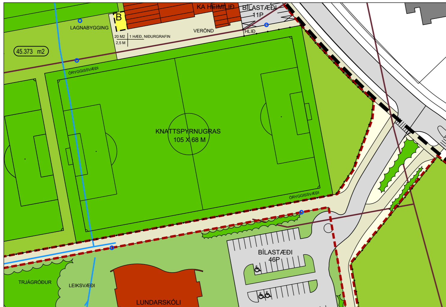
GILDANDI DEILISKIPULAG, ÖÐLAÐIST GILDI 18.11.2008, M.S.BR.