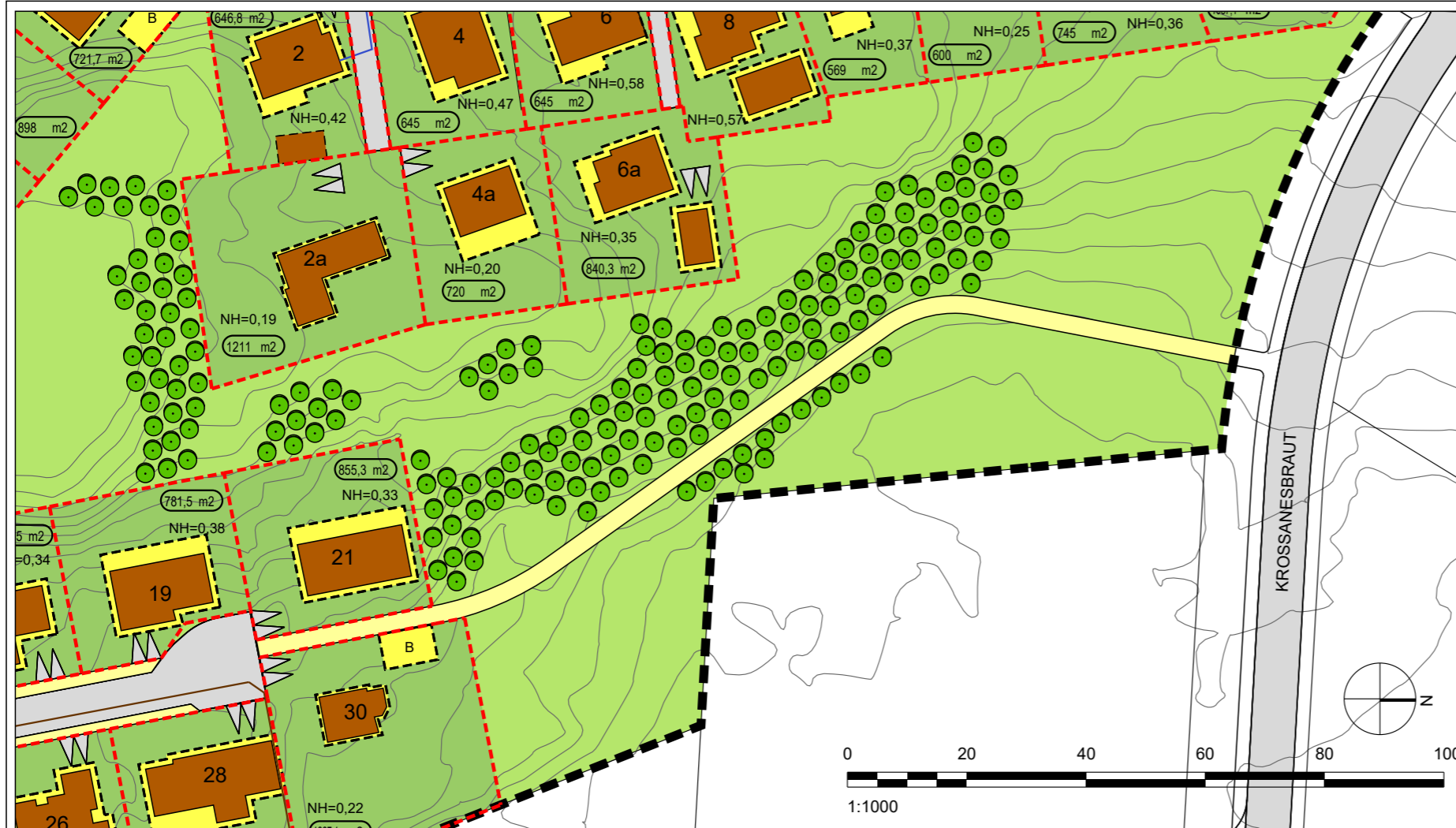
GILDANDI DEILISKIPULAG, ÖÐLADIST GILDI 17.12.2012, M.S.BR.