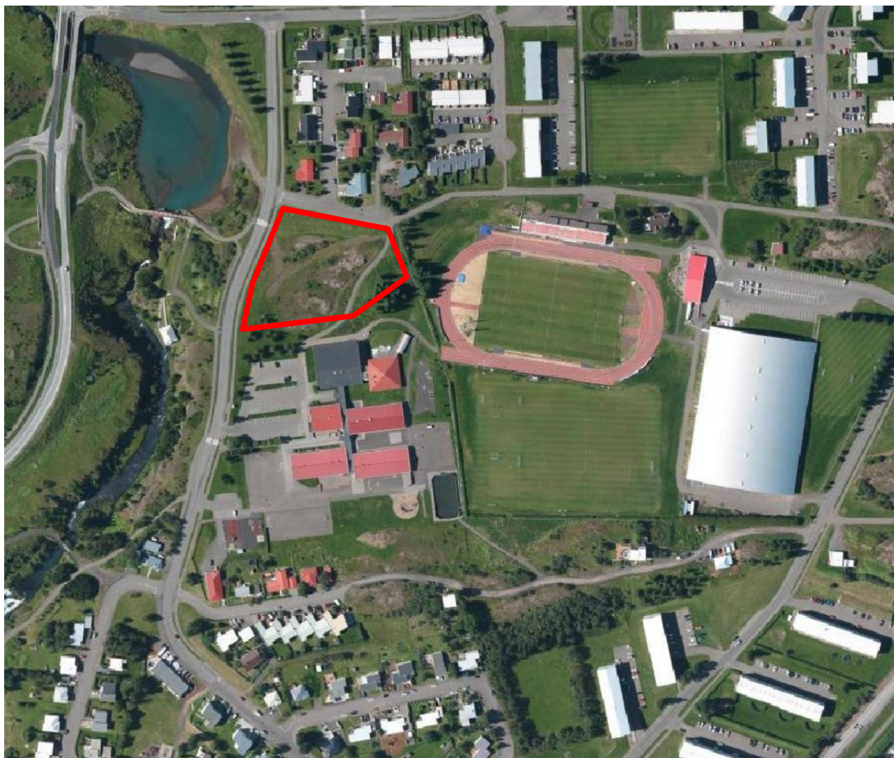
Mynd 1. Loftmynd sem sýnir staðhætti, rauð útlína sýnir afmörkun þess svæði sem breytingin nær til.