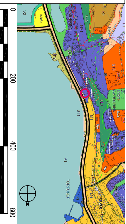
ÚRRÁTTUR ÚR AÐALSKIPULAGI AKUREVRYAR 2018 - 2030