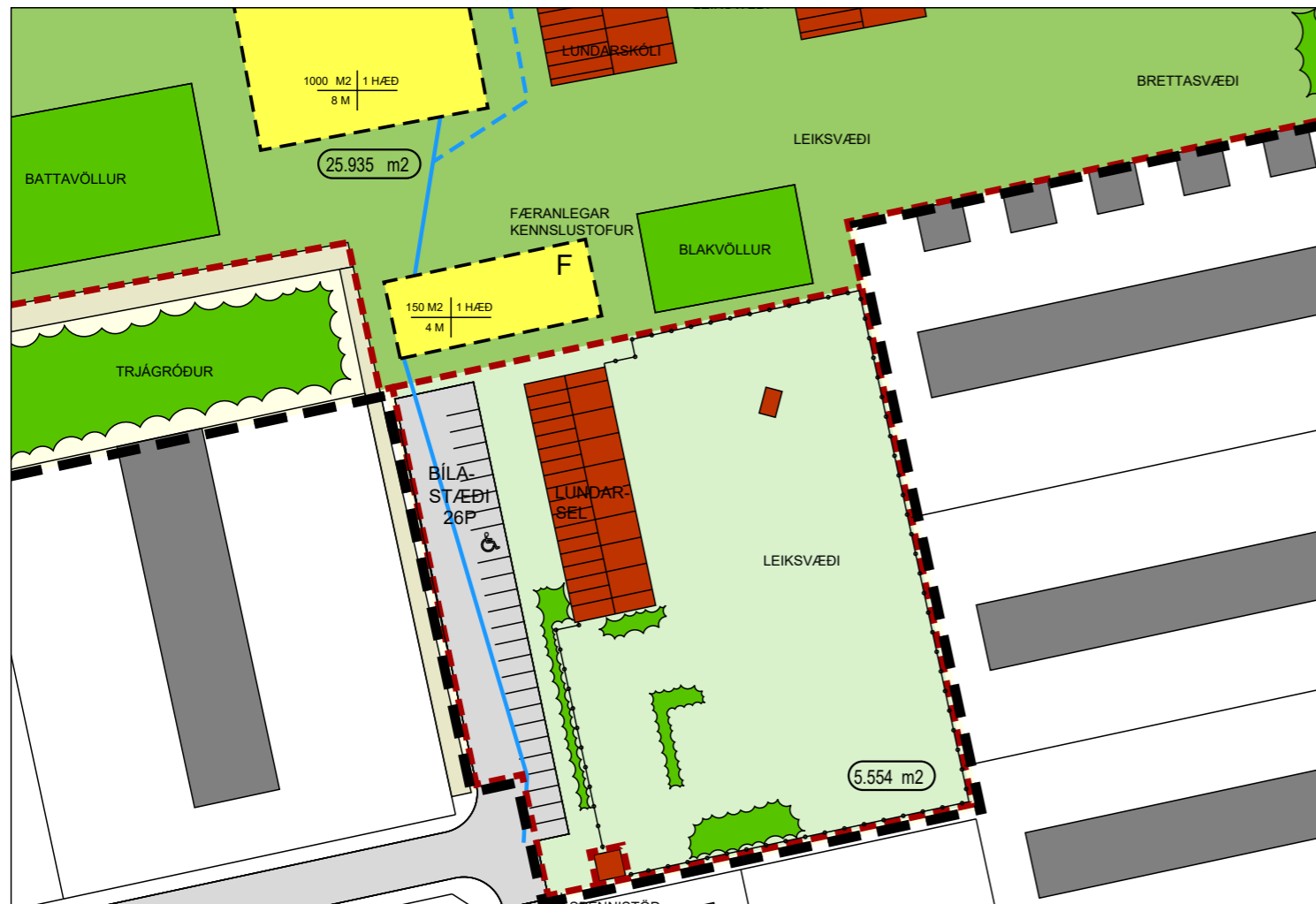
GILDANDI DEILISKIPULAG, ÖÐLAÐIST GILDI 18.11.2008, M.S.BR.