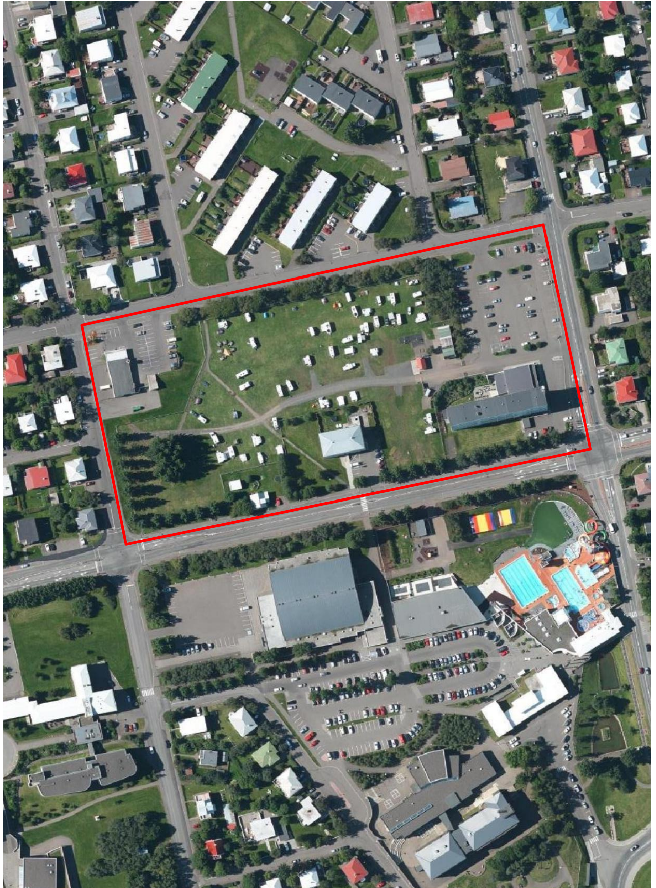
Mynd 1. Loftmynd sem sýnir staðhætti, rauð útlína sýnir afmörkun þess svæði sem breytingin nær til.