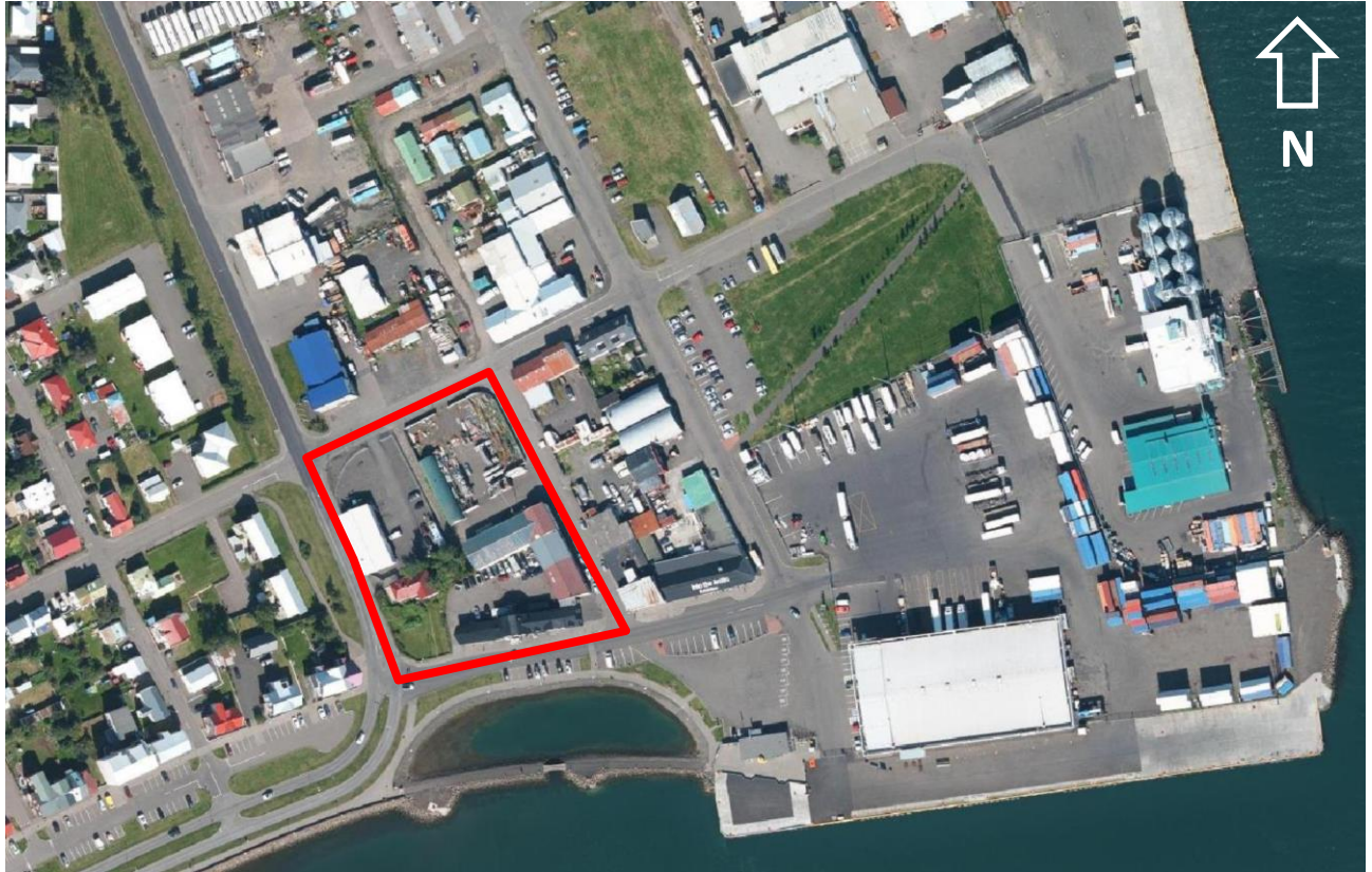
Mynd 1. Loftmynd sem sýnir staðhætti, rauð útlína sýnir afmörkun þess svæðis sem breytingin nær til.