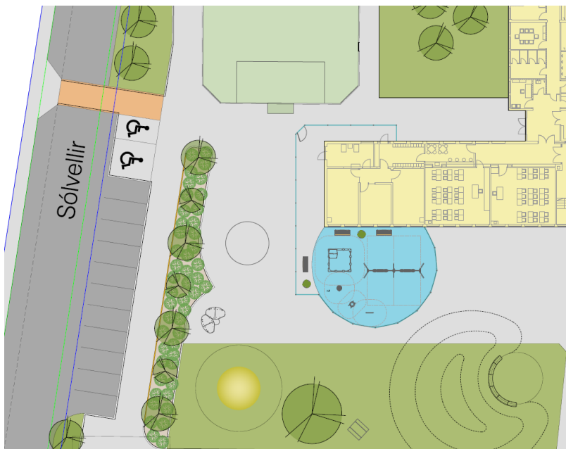
Mynd 1; Útfærsla á lóð og skóla

Kostnaðar áætlun fyrir lóð og bílastæði var áætlaður 18-20 mkr.