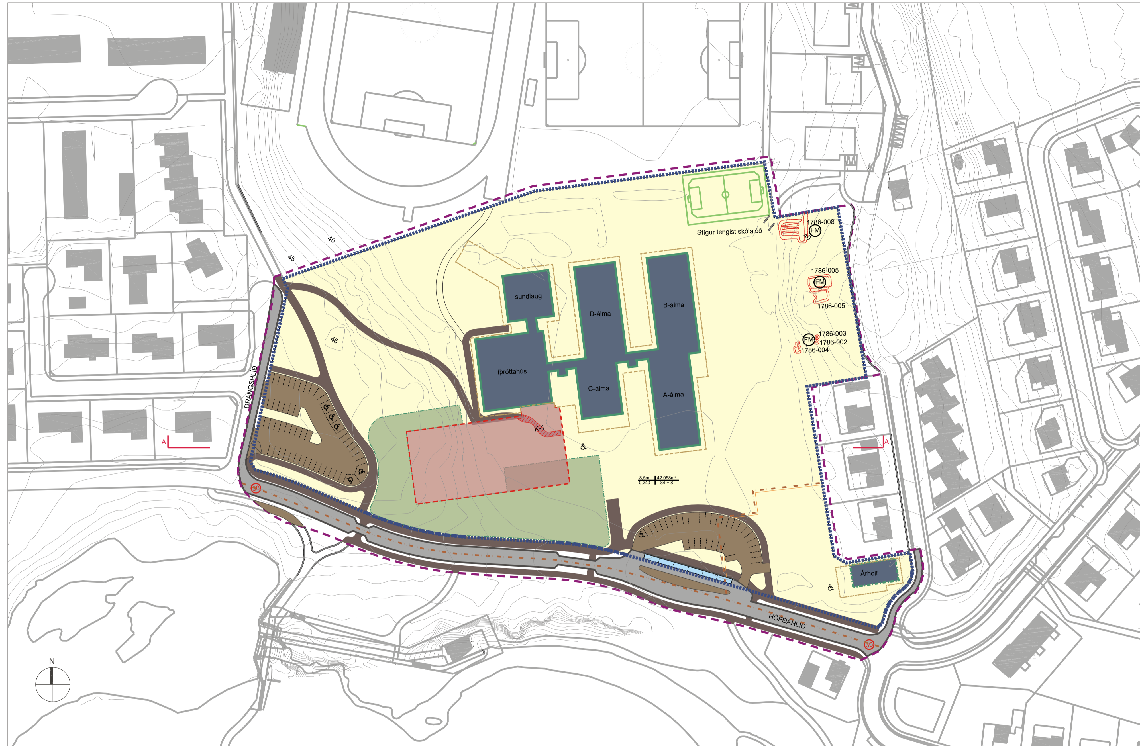
DEILISKIPULAGSUPPRÁTTUR, 1:1000 @A1