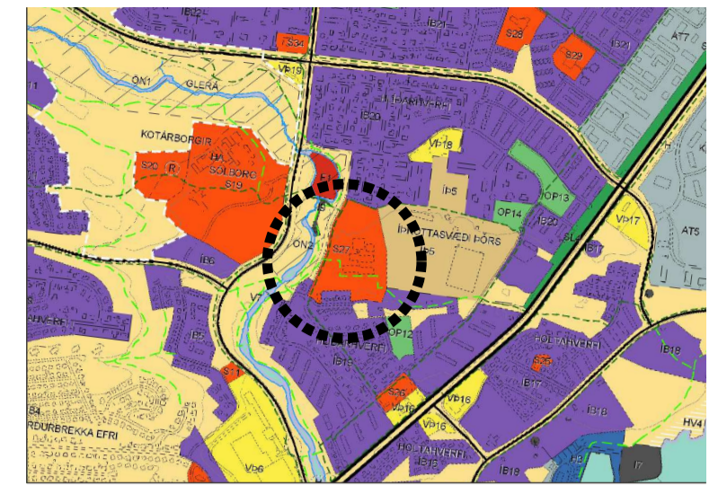
ADALSKIPULAG AKUREYRAR 2018-2030, BREYTTUR MKV. 1 : 20.000

DRÖG AÐ DEILISKIPULAGI FYRIR SKÓLA- OG ÍÞRÓTTASVÆÐIS GLERÁRSKÓLA, NÝS LEIKSKÓLA, ÍÞRÓTTAÚSS OG SUNDLAUGAR.